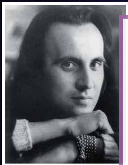
Wolfgang Borchert 1947.

Ein Theaterabend, der aufrüttelt und nachwirkt – und die Tür nicht leise schließt. Denn Beckmann steht nicht nur draußen. Er steht vor uns.